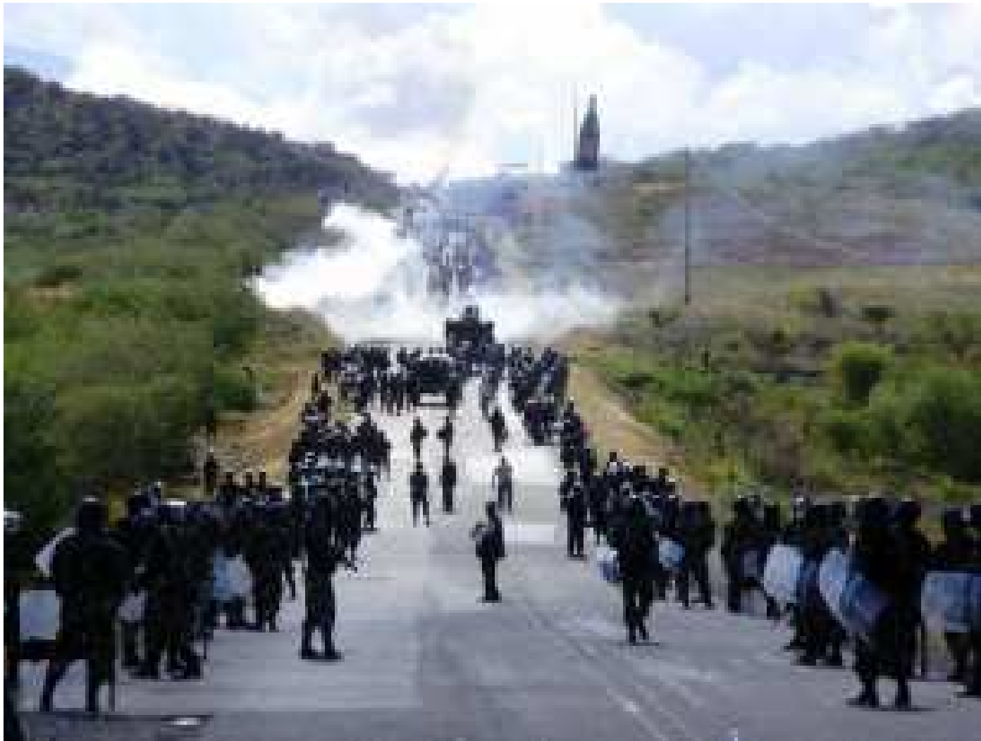
Amazonía Peruana. Ciudad de Bagua, 2009