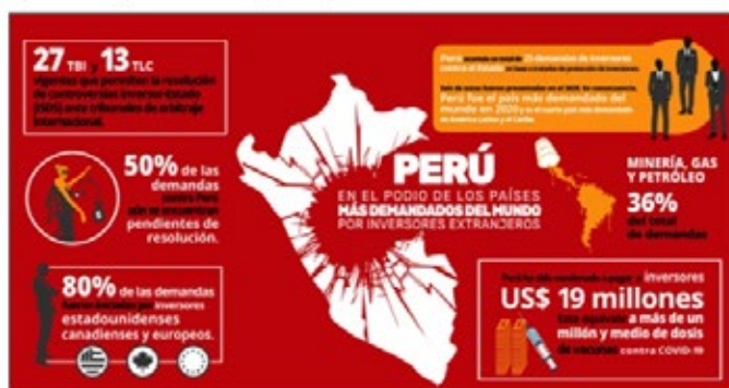
Infografía elaborada por RedGE.