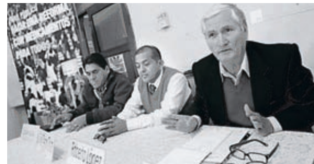
Red. Solicita reformas al presidente Ollanta Humala.

Preocupación y fastidio generan en varias asociaciones de pacientes nacionales la dificultad que tienen los peruanos en conseguir medicamentos de necesario uso por el público. Según denunció la Red Peruana de Pacientes y Usuarios del Sistema de Salud (RPPU), constantes desabastecimientos de medicamentos para el VIH sida, tuberculosis, hemofilia y lupus, entre otros males, se registran en hospitales del Ministerio de Salud y de EsSalud, lo que perjudica a miles. "Yo tengo dos hijos adolescentes con hemofilia y ellos necesitan tomar semanalmente unas