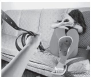
Violencia. Es inaceptable.